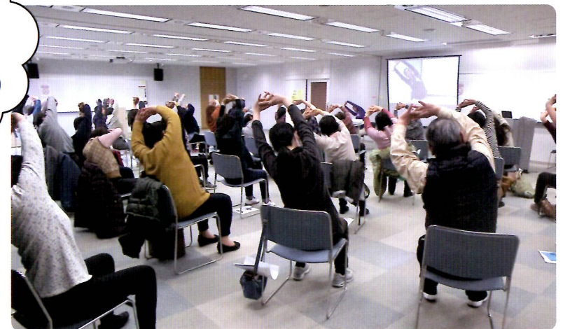
体や心の健康講座