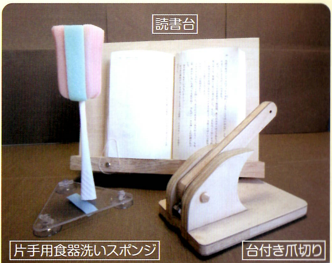
自助具製作品の一例

「自助具」とは、加齢や病気・怪我などで体に不自由さが出てきた時に、日常生活をより便利に、より楽にできるように工夫された道具のことです。高齢の方や障がいのある方の生活の不便さは、一人ひとり違い、用具もその方に合わせると使いやすくなります。 「市販品を購入したけれど使いにくい」「市販品にはない用具を作ってほしい」などの声にお応えし、市販の用具の調整や、簡単な自助具の製作を行います。