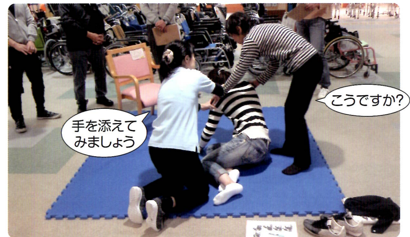
介助方法の実技講座